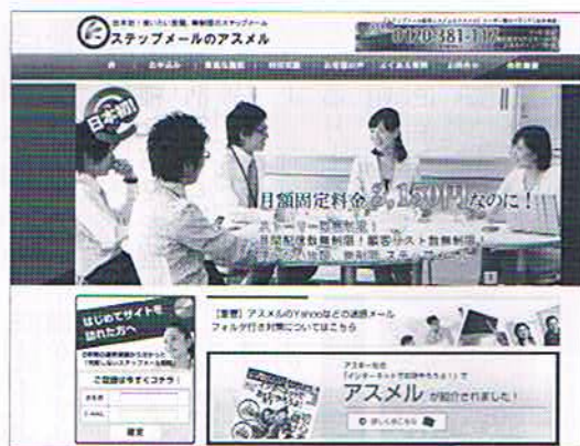
低料金と使い放題で人気のアスメル

ところが、ステップメールを送る際に問題点も。迷惑メールとしてみなされ、相手に届かないことがあるのだ。主な原因は共有サーバーを利用すると、利用者の中に悪質なメールを送るユーザーがいた場合、同じIPアドレスを持つメールが誤認されてしまうからだ。そこで同社ではこの問題を解決するため、新たなサービスとして昨年10月から「アスメル・プラチナ」プランを開始した。これは共有サーバーを利用しなが