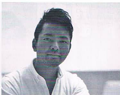
作野社長は同社を合わせ3つの会社を運営。最近はずから起業メソッドを伝える勉強会も開催している

■会社概要 本社・東京都港区六本木7-20 18（六本木ポイントビル）2003 立2003年／資本金100万円／従業員 3名 http://www.legendproduce.co.jp/